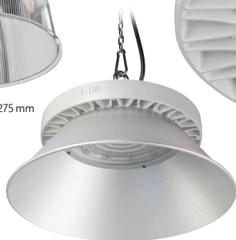
Rifleteur Aluminium pour Ø 275 mm