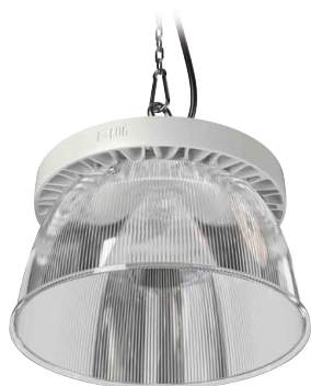
Rifleteur PC strié pour Ø 275 mm