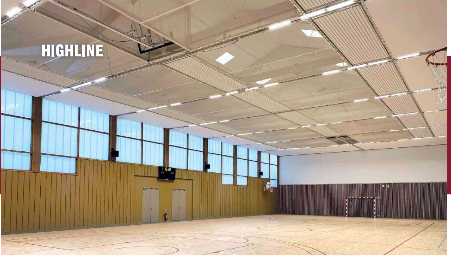
Gymnase Civrieux-d'Azergues / STREM / GUILLOT